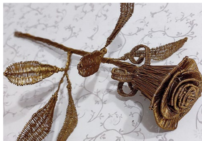
▲ Розочка из меди от Дмитрия Смирнова